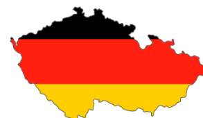
Německo – Česká R.