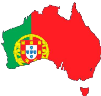
Portugalsko - Austrálie