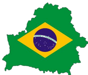
Brazílie - Bělorusko

Každý z 16 obrázků šifry reprezentuje vlajku jednoho státu a obrys hranic státu jiného. Pokud vezmeme jejich české názvy, a z nich společná písmenka, tak nám tato společná písmena čtená zleva dají tajenku BENESOV U STRELNICE .