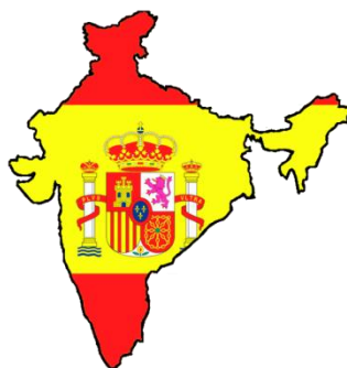
Španělsko - Indie