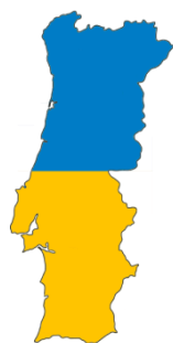
Ukrajina - Portugalsko