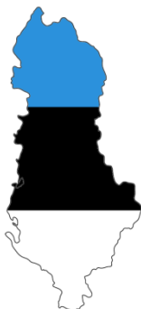
Estonsko - Albánie