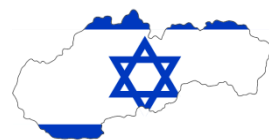
Izrael - Slovensko