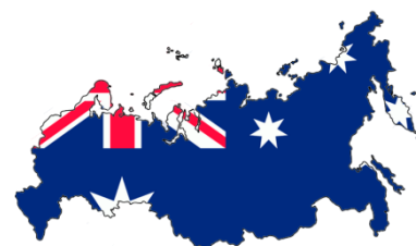
Austrálie - Rusko