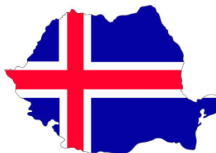
Island - Rumunsko