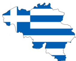
Řecko - Belgie