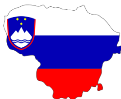
Slovinsko - Litva