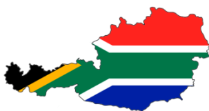
Jihoafrická R. - Rakousko