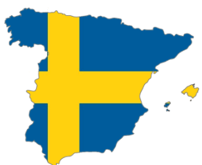
Švédsko - Španělsko