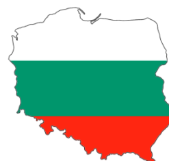
Bulharsko - Polsko